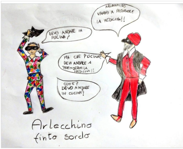
Greta: 🤪🤪 – ANONIMO