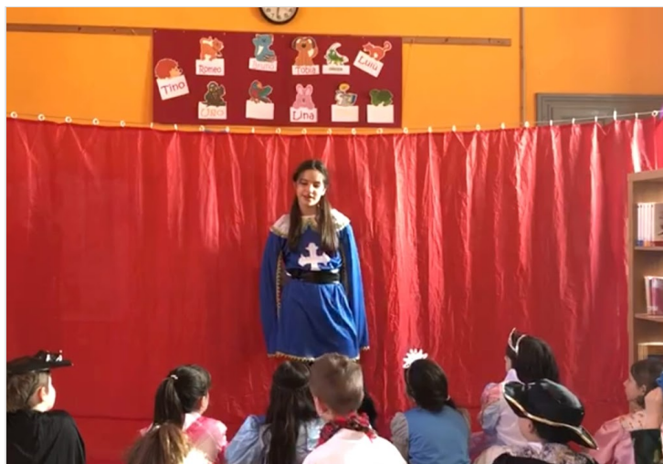
Greta: è stata una recita bellissima, mi sono divertita molto! 😊💕 – ANONIMO